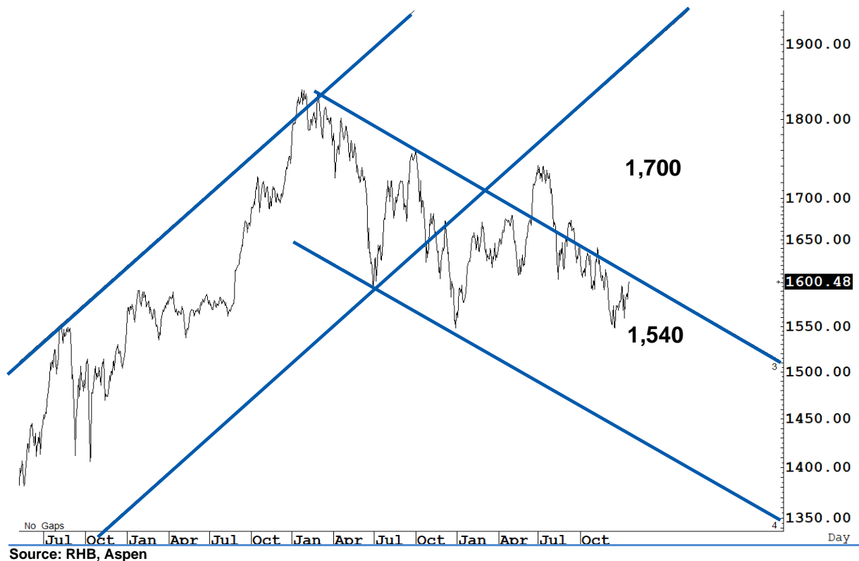
Figure 1 : SET Index daily chart